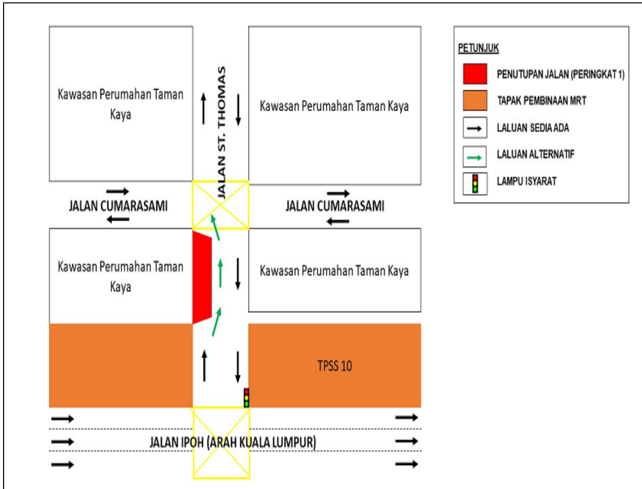
PETA 1: LANJUTAN PENUTUPAN JALAN SEPARA BERPERINGKAT DI JALAN ST. THOMAS, JALAN IPOH

Motorists are advised to follow the traffic signage and the direction of the flagman during activation of these road closures. For further information, please refer to the maps below.