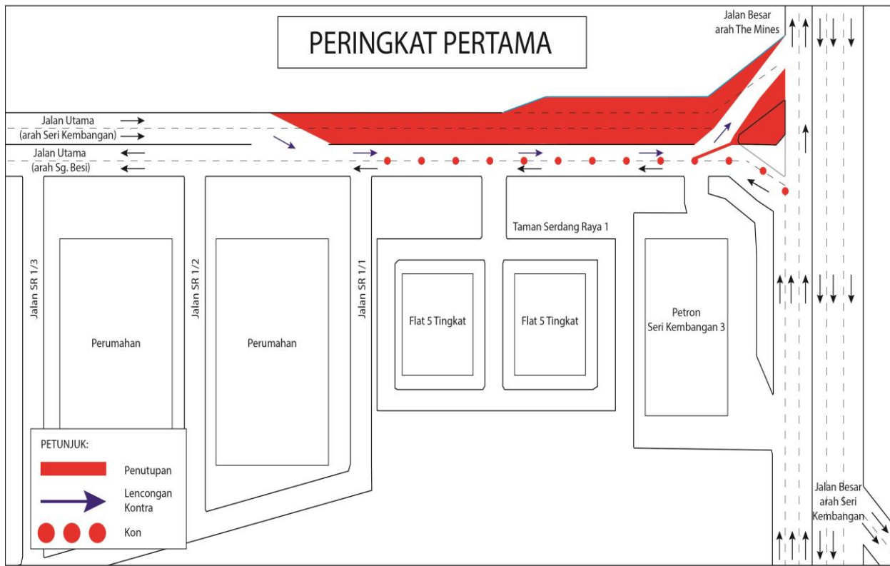
PETA 1(A): PENUTUPAN PENUH DAN PENGAKTIFAN LALUAN KONTRA SECARA BERPERINGKAT DI SEPANJANG JALAN UTAMA (ARAH SERI KEMBANGAN DAN ARAH SUNGAI BESI)

Stage 1: During the full bound closure for a stretch of 200 metres along Jalan Utama (Seri Kembangan-bound) nearby Petron Petrol Station, motorists heading to The Mines will be diverted to the provided contra flow at Jalan Utama (Sungai Besi-bound) (as indicated by PURPLE arrows in MAP 1(A) ).