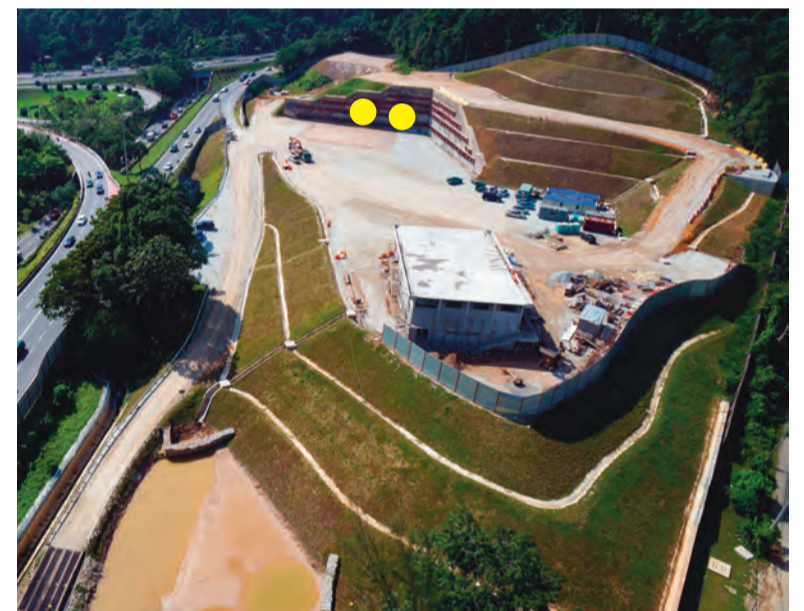
TRANSFORMASI • Pandangan dari atas Portal Semantan di mana MRT akan bertukar dari jajaran bertingkat menjadi jajaran bawah tanah. Dua bulatan kuning di dalam gambar menunjukkan lokasi di mana terowong akan dikorek.

Terowong-terowong MRT akan dibina menggunakan mesin pengorek terowong ataupun tunnel boring machine (TBM). Mesin-mesin ini akan menggali di bawah tanah tanpa mengganggu aktiviti yang dijalankan di permukaan bumi. Sebanyak 10 buah TBM akan digunakan.