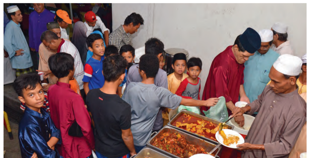
SETELAH SEHARI BERPUASA • Penduduk beratur menunggu giliran untuk mengambil makanan.

Ini bagi memastikan golongan yang akan mengalami impak langsung daripada pembinaan projek dapat dimaklumkan tentang apa yang bakal berlaku dan kesulitan yang mungkin dihadapi. Sesi-sesi bersama orang ramai yang diadakan memberi ruang kepada penduduk untuk membangkitkan segala persoalan dan kebimbangan tentang projek.