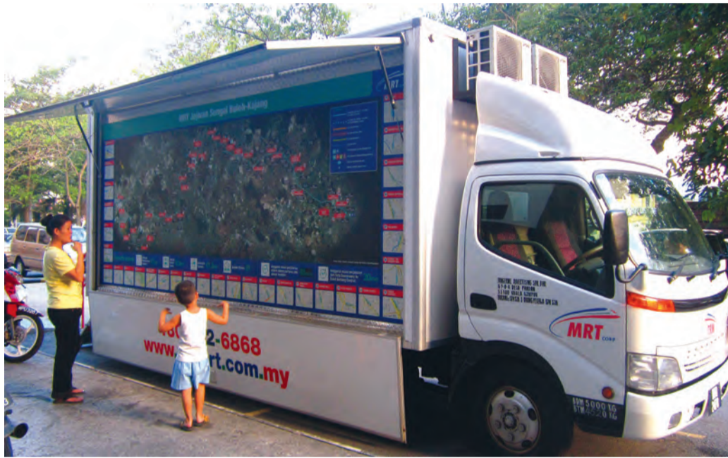
PENUH PERHATIAN • Seorang ibu bersama anaknya meneliti peta yang terdapat di MIT.

MIT beroperasi setiap hari kecuali Isnin. MIT ditempatkan di lokasi-lokasi tumpuan orang ramai seperti pasar, tempat ibadat, pusat membeli-belah, pejabat, organisasi media, universiti, kolej dan juga sekolah. Orang ramai juga boleh mendapatkan jadual MIT daripada laman sesawang www.mymrt.com.my .