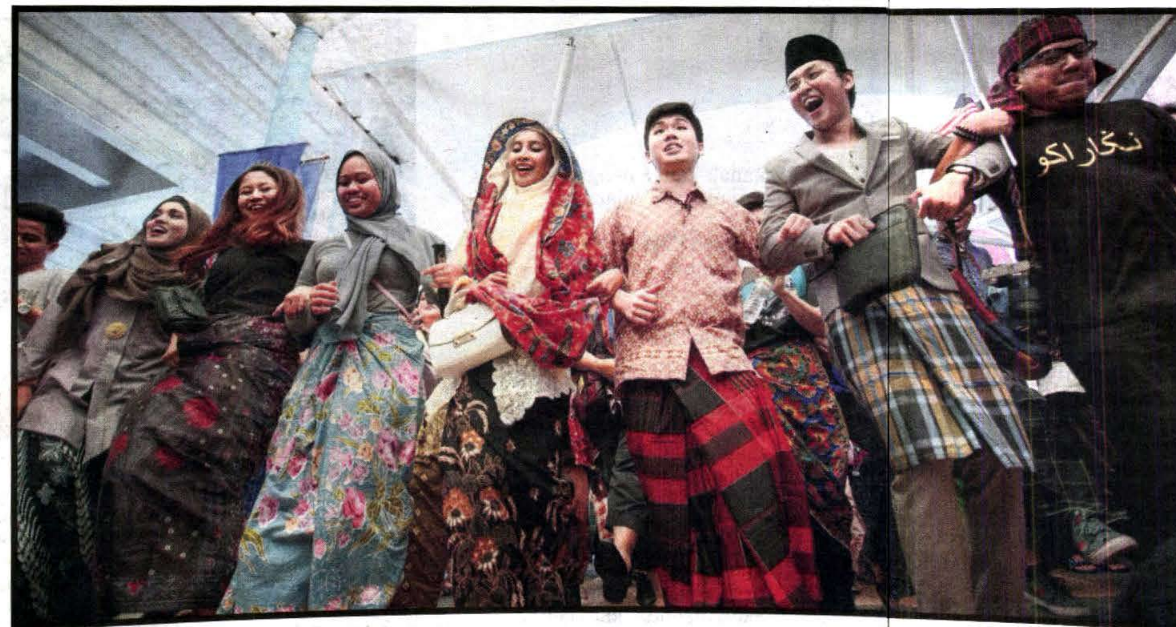
KERETAPI Sarong 2017 mempunyai matlamat meraikan busana, warisan, bandar raya dalam semangat sambutan Hari Malaysia.