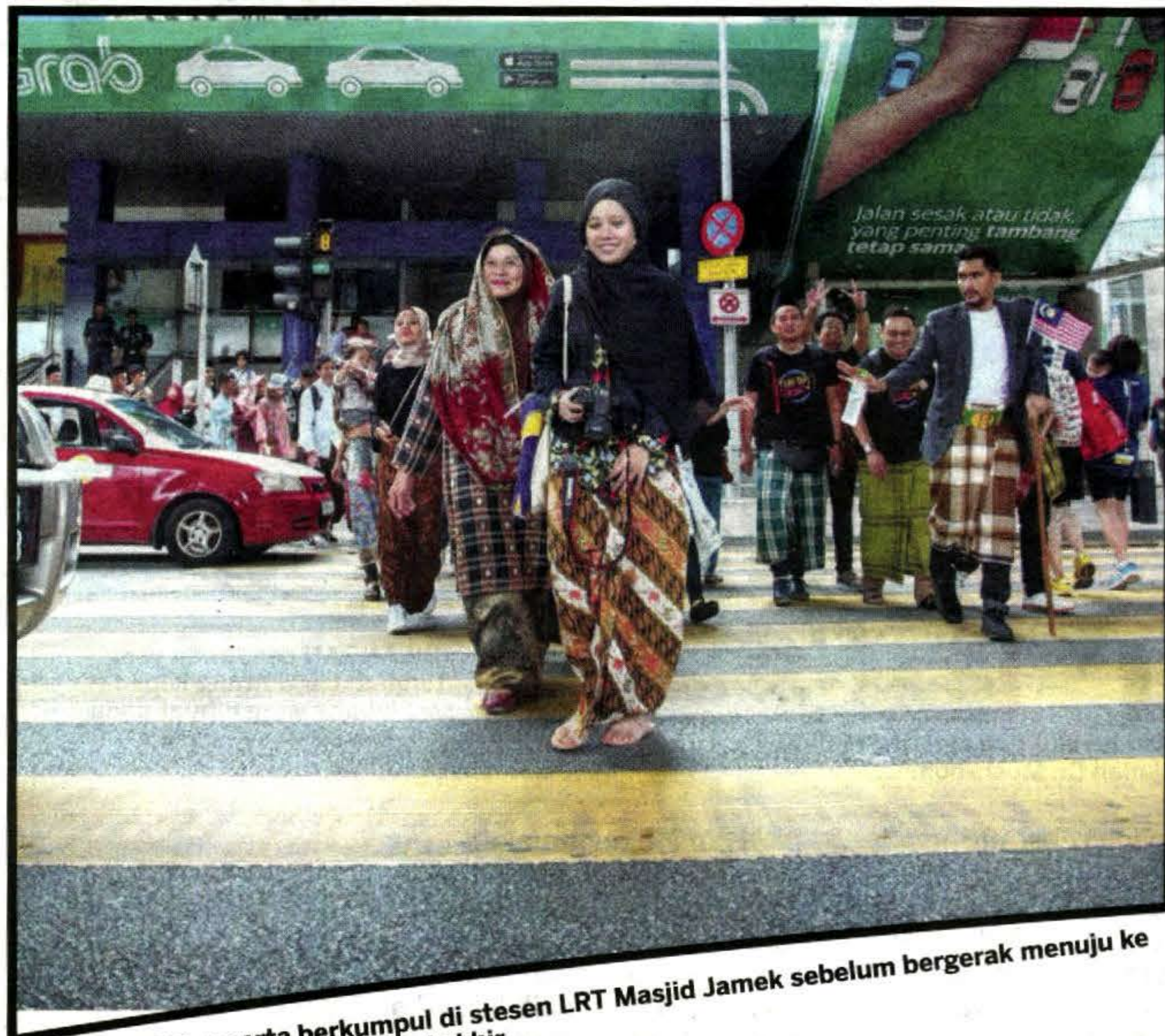
ROMBONGAN peserta berkumpul di stesen LRT Masjid Jamek sebelum bergerak menuju ke Muzium Negara sebagai destinasi akhir.