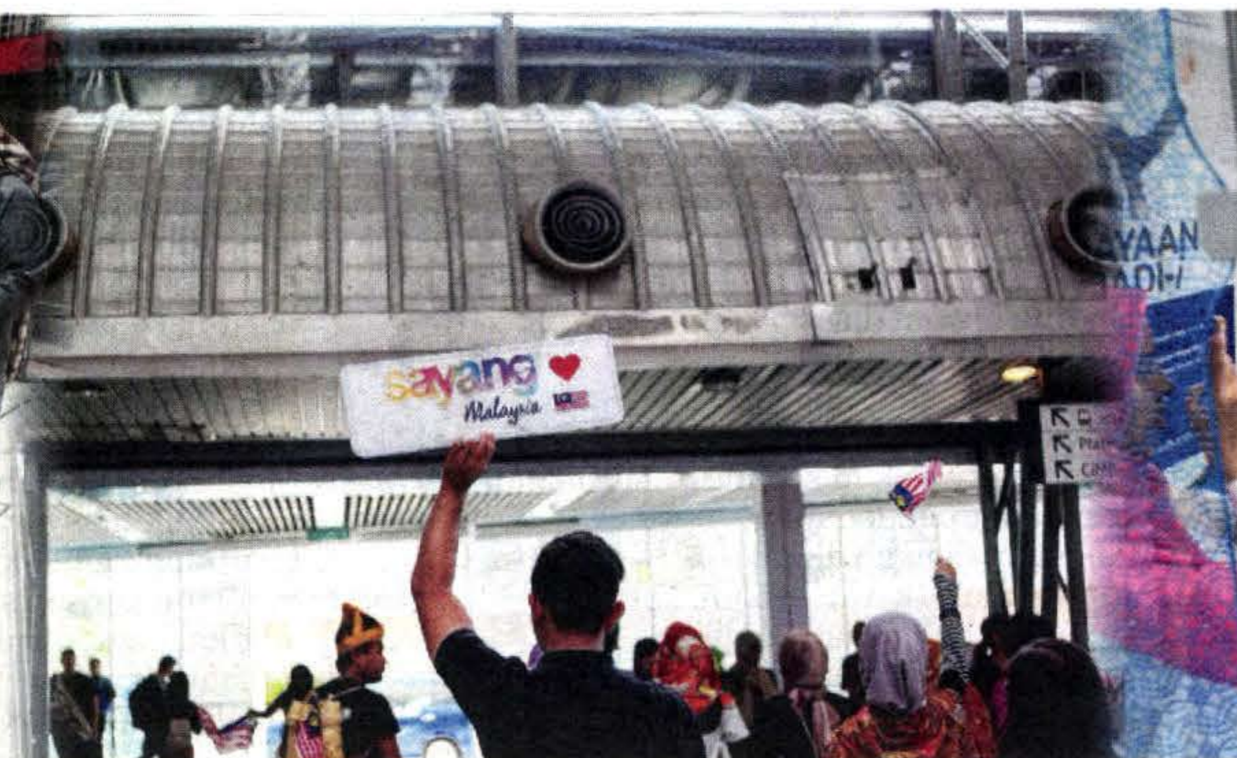
SLOGAN Sayang Malaysia bertujuan memupuk rasa cinta kepada negara.