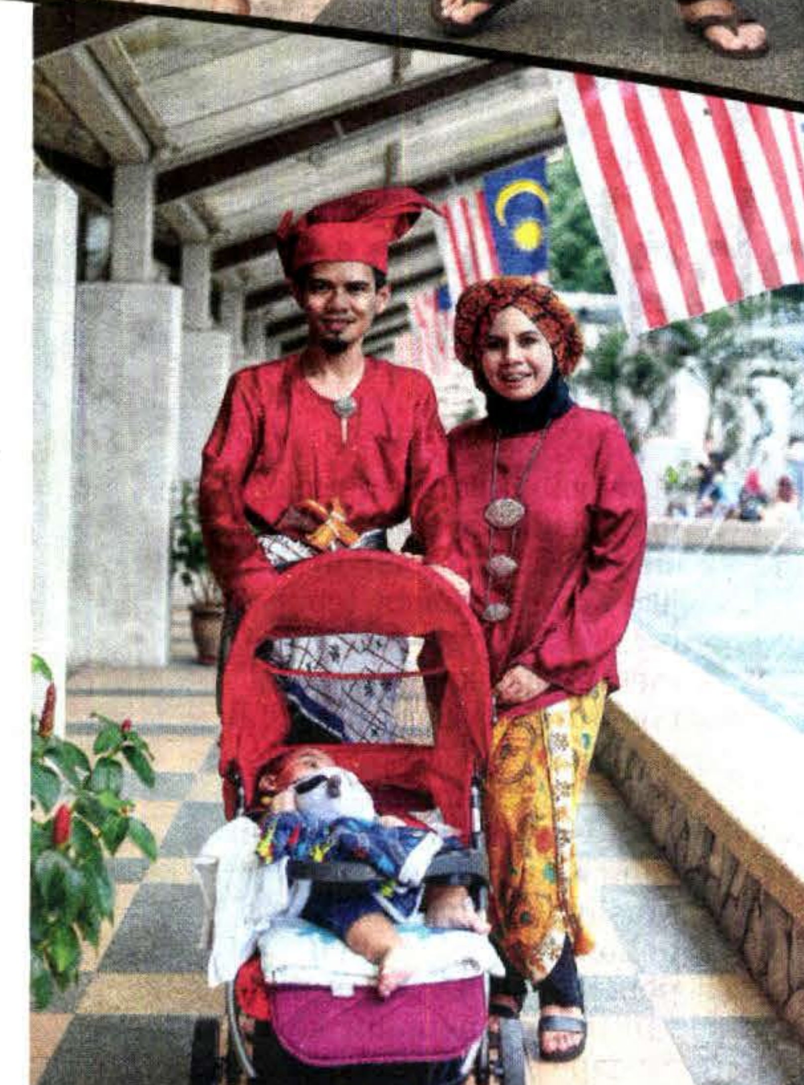
KERETAPI Sarong turut menjadi wadah untuk peserta meluangkan masa berkualiti bersama keluarga.

"Idea ini sebenarnya datang secara spontan pada saat-saat akhir sehari sebelum Keretapi Sarong berlangsung. Beginilah uniform kami ketika belajar mengaji muqaddam pada zaman kanak-kanak," imbaunya sambil tersenyum.