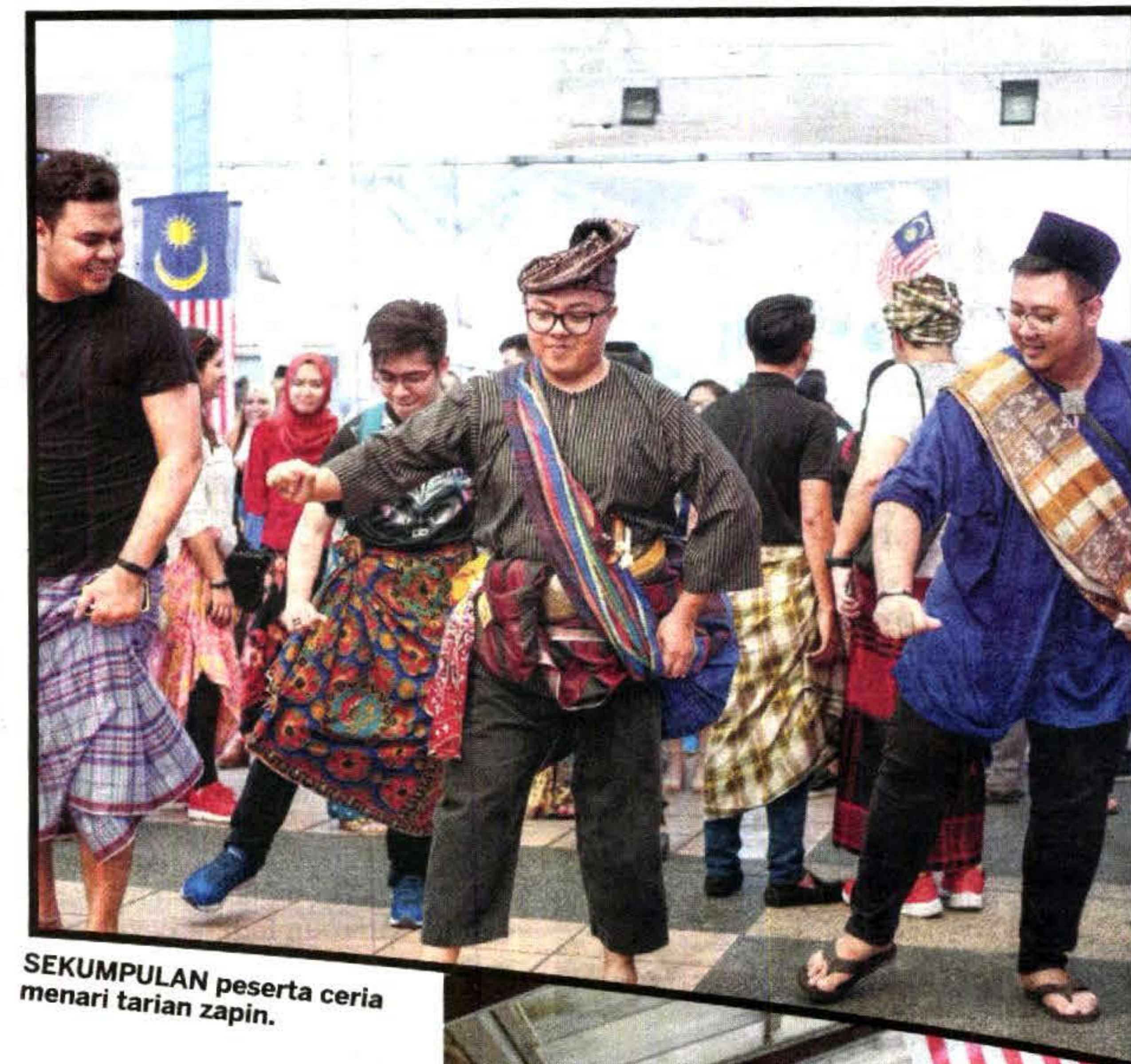
SEKUMPULAN peserta ceria menari tarian zapin.