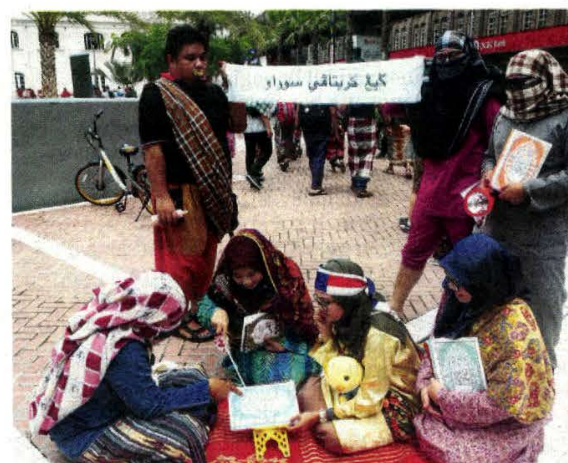
GENG Kereta api Surau ini ditubuhkan secara spontan oleh tujuh sahabat baik.