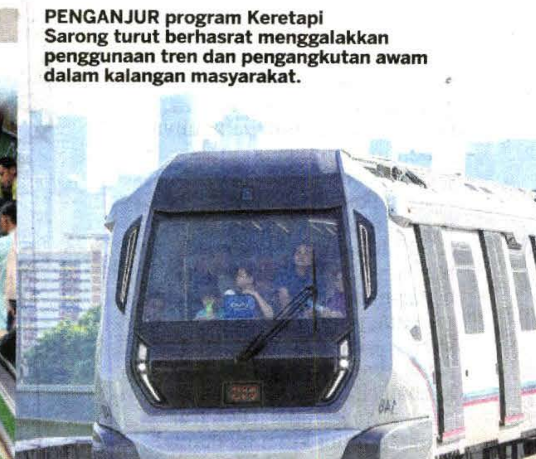
PENGANJUR program Keretapi Sarong turut berhasrat menggalakkan penggunaan tren dan pengangkutan awam dalam kalangan masyarakat.