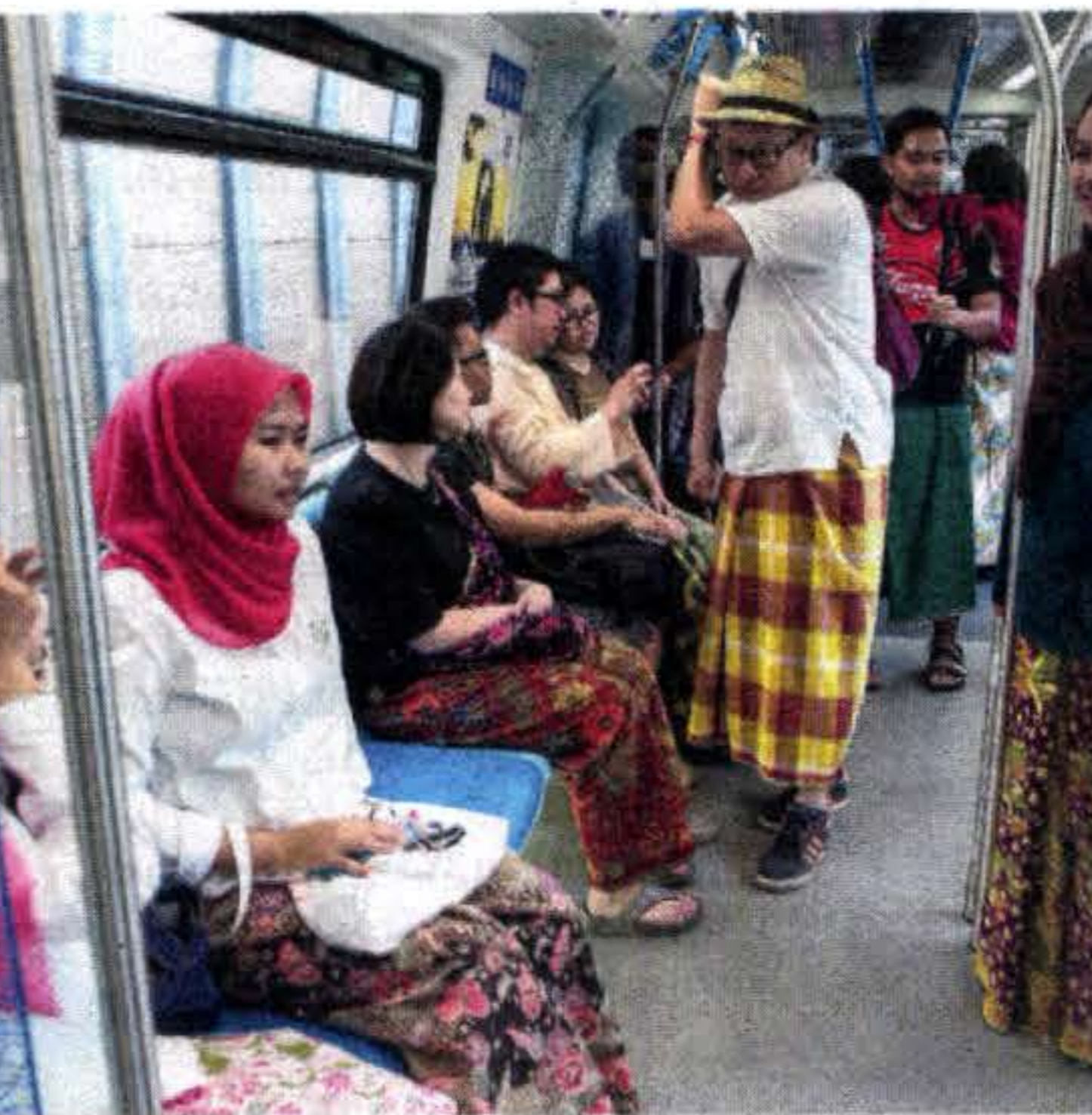
GELAGAT pengunjung yang menggayakan busana asli mengukir rasa dan kreativiti masing-masing.