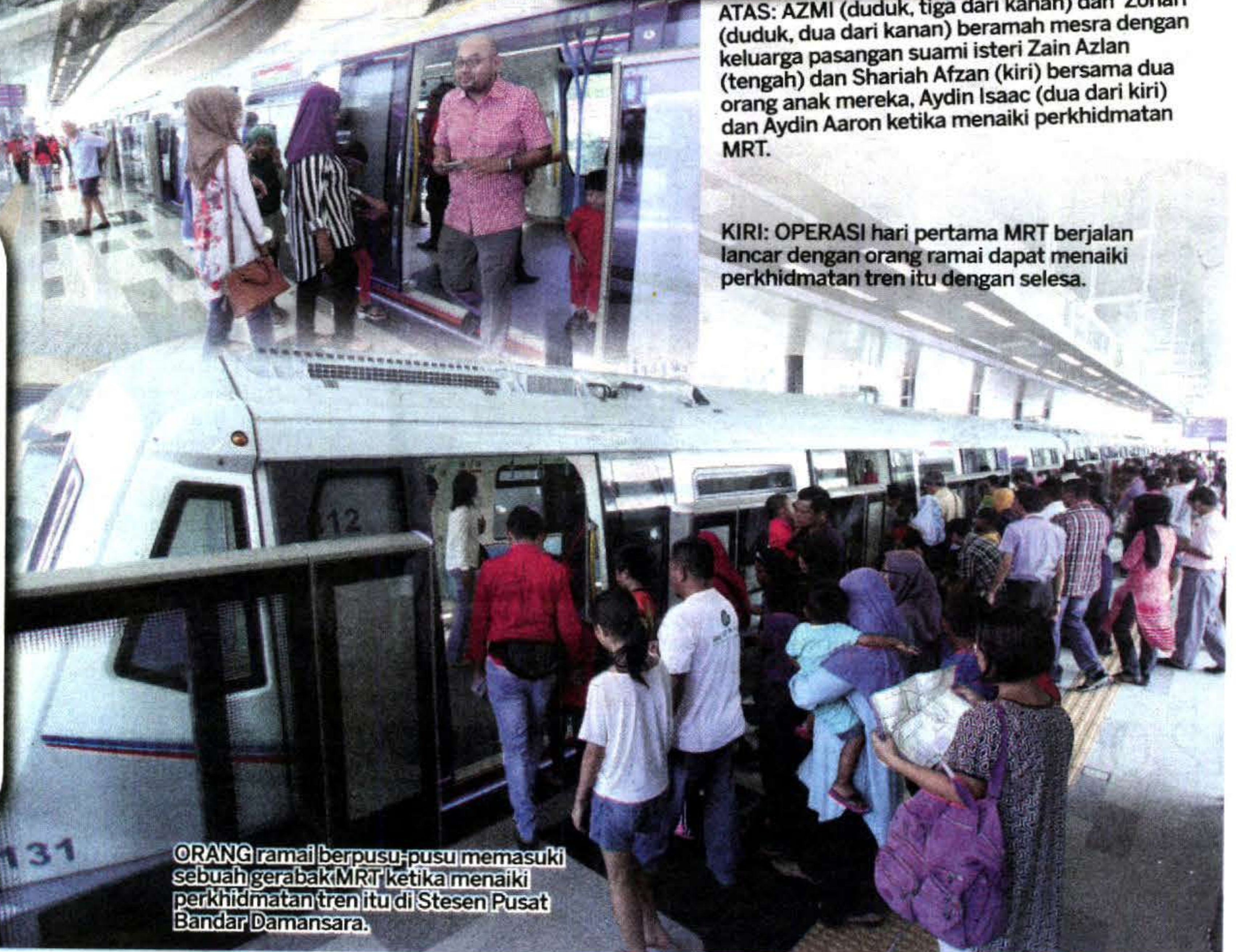
ORANG ramai berpusu-pusu memasuki sebuah gerabak MRT ketika menaiki perkhidmatan tren itu di Stesen Pusat Bandar Damansara.