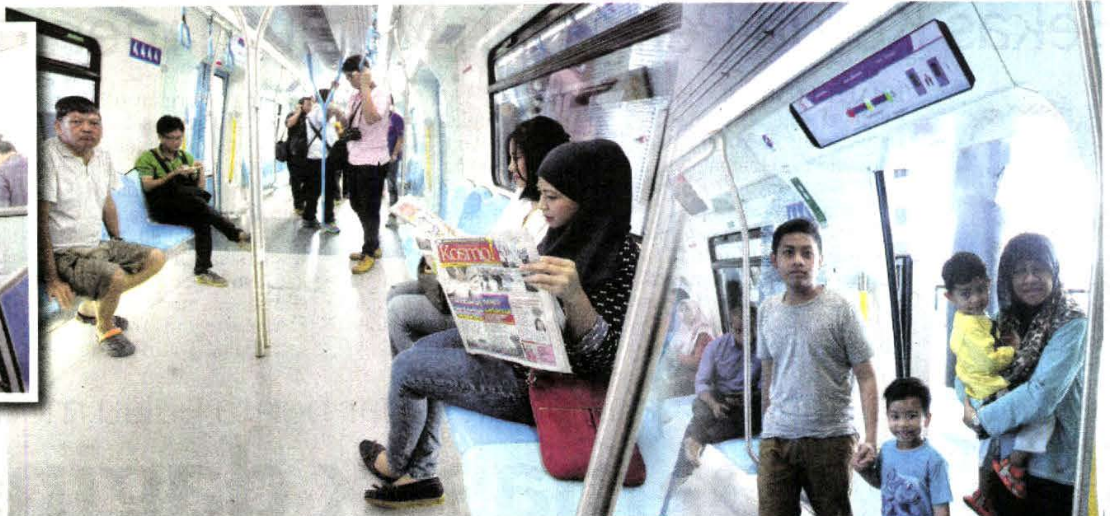
DUA penumpang wanita mengambil kesempatan membaca akhbar Kosmo! ketika melalui pengalaman pertama menaiki perkhidmatan MRT dari Stesen Pusat Bandar Damansara.