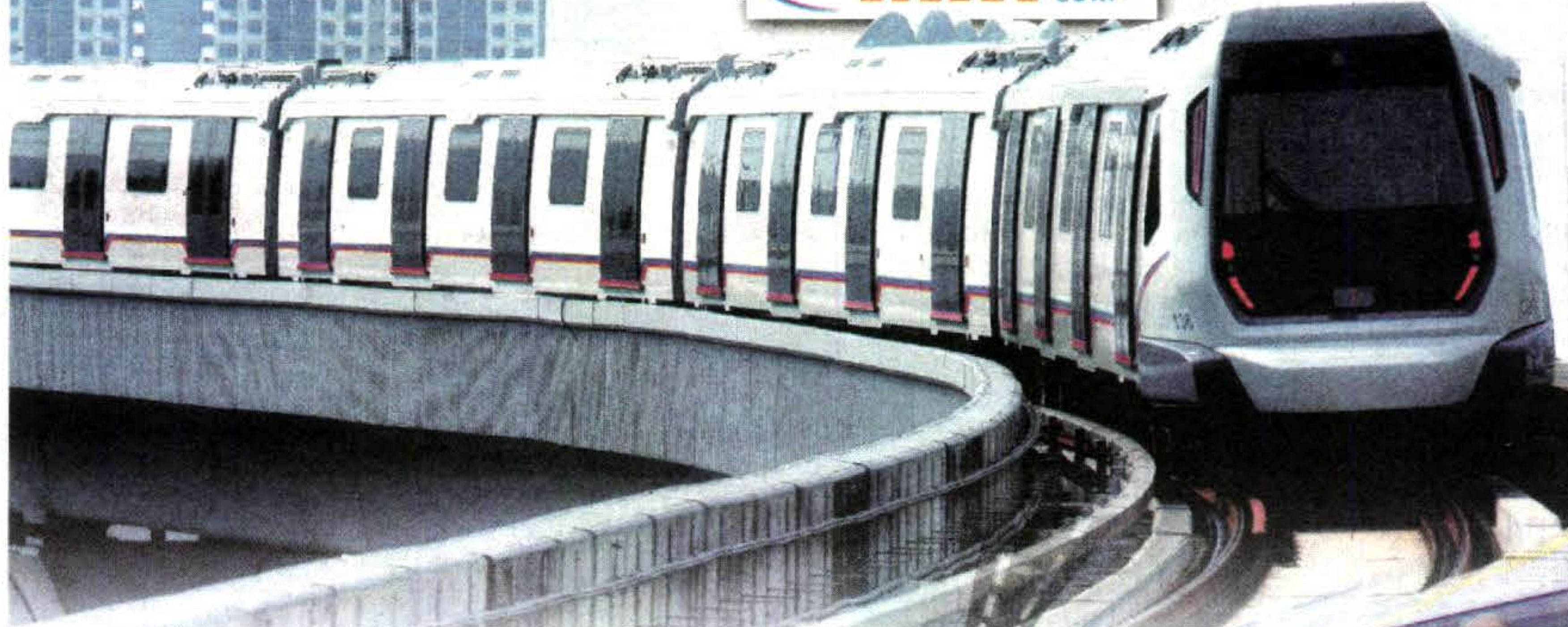
TREN MRT bergerak lancar dari Stesen Pusat Bandar Damansara ke Stesen Sungai Buloh, Selangor.