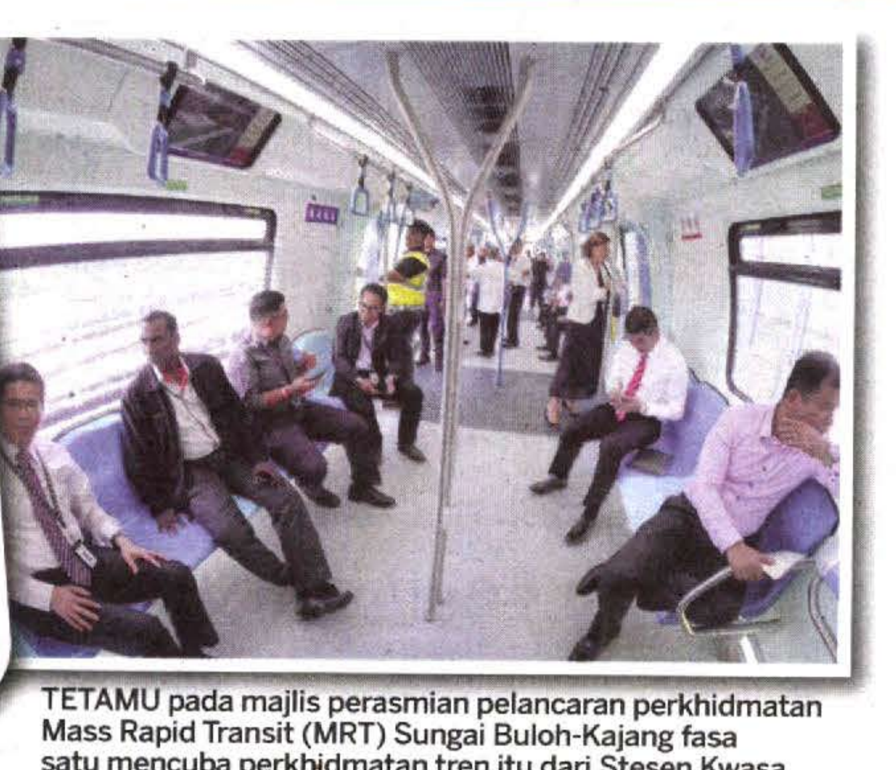
TETAMU pada majlis perasmian pelancaran perkhidmatan Mass Rapid Transit (MRT) Sungai Buloh-Kajang fasa satu mencuba perkhidmatan tren itu dari Stesen Kwasa Damansara ke Sungai Buloh semalam.