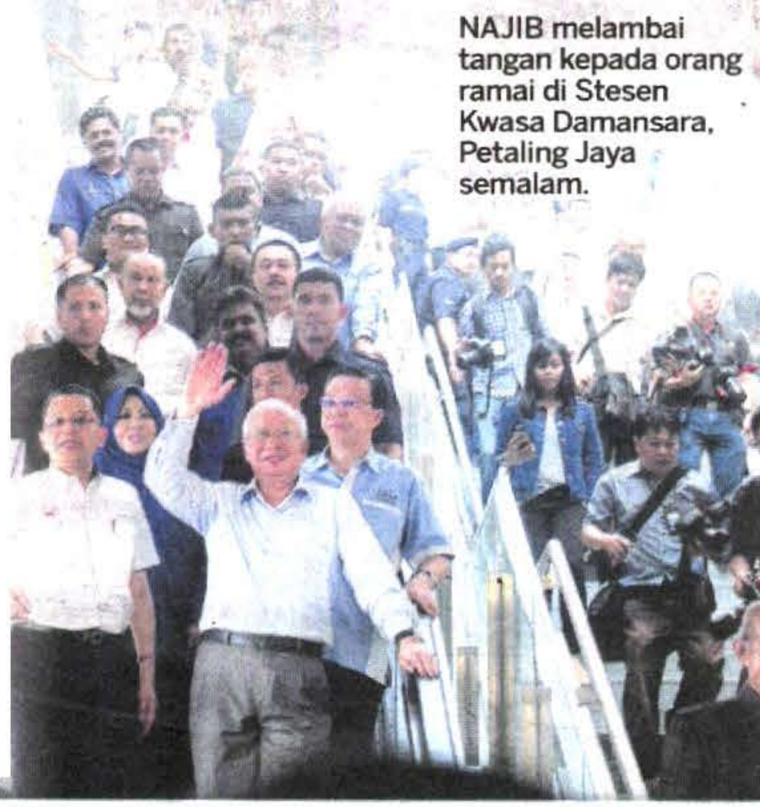
NAJIB melambai tangan kepada orang ramai di Stesen Kwasa Damansara, Petaling Jaya semalam.