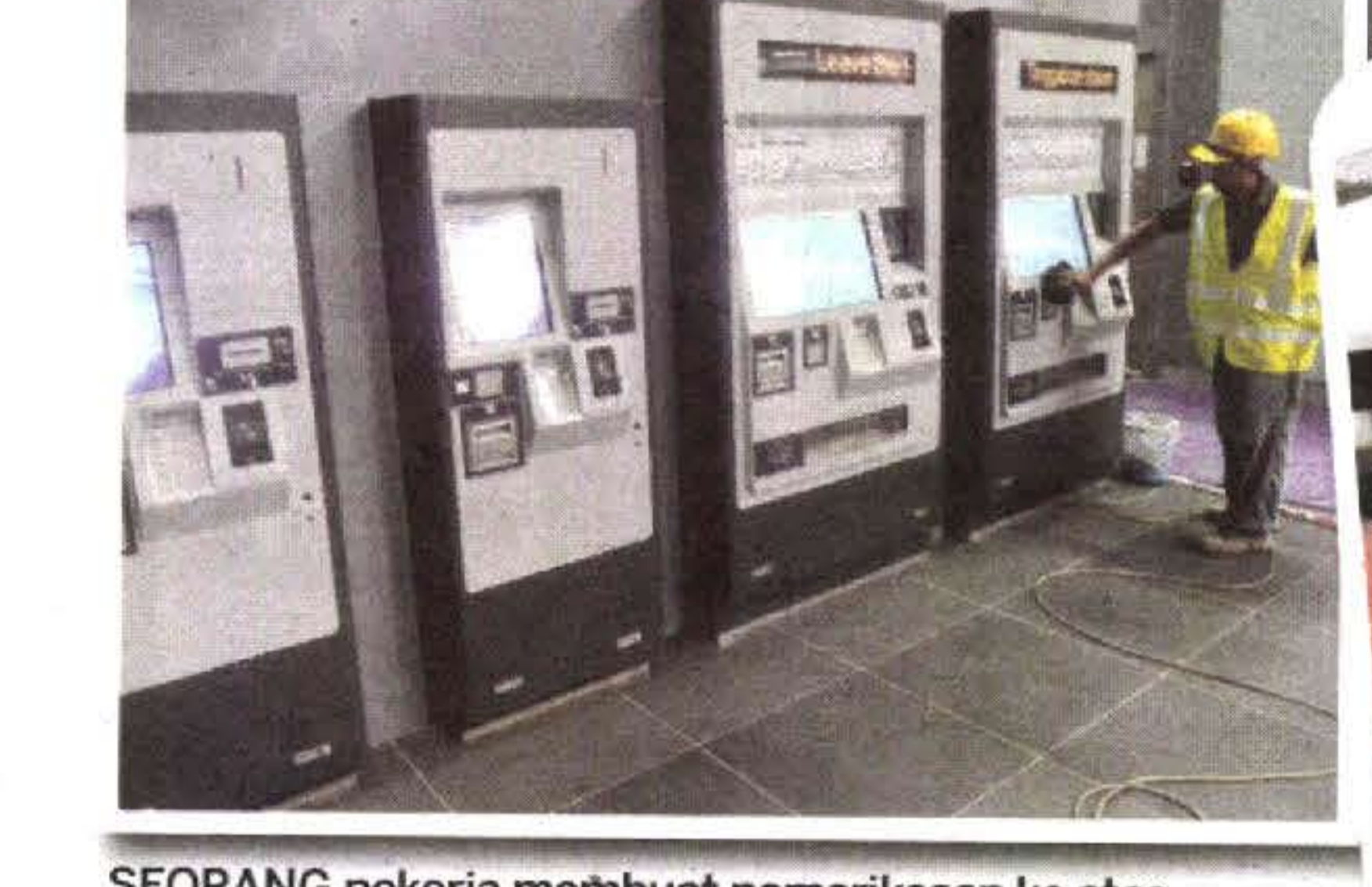
SEORANG pekerja membuat pemeriksaan ke atas mesin pembelian tiket perkhidmatan MRT Sungai Buloh-Kajang menjelang pembukaan operasinya kepada orang ramai hari ini.