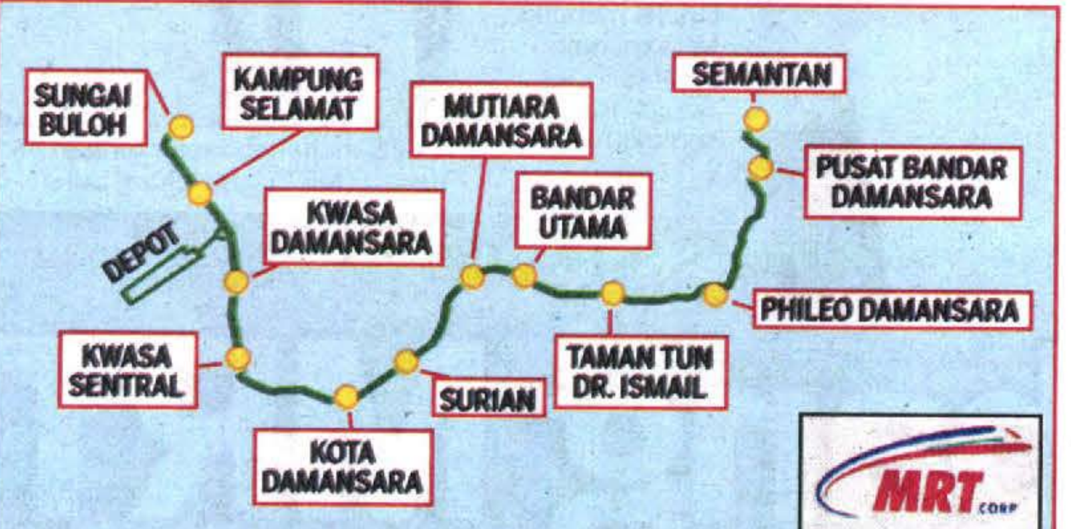
JAJARAN perkhidmatan MRT dari Sungai Buloh ke Semantan.

Transformasi Ekonomi tersebut menelan belanja sebanyak RM21 bilion. Katanya, projek itu berjaya menjimatkan kira-kira RM23 bilion daripada kos sasaran RM23 bilion yang ditetapkan oleh kerajaan. Perdana Menteri turut melancarkan projek ini akan berintegrasi dengan stesen-stesen Komuter, LRT, Monorel dan ERL," katanya ketika berucap pada majlis pelancaran operasi fasa pertama MRT Laluan Sungai Buloh-Kajang (SBK) di sini semalam. Ali berkata, bagi kemudahan para pengguna, perkhidmatan bas pengantara MRT yang