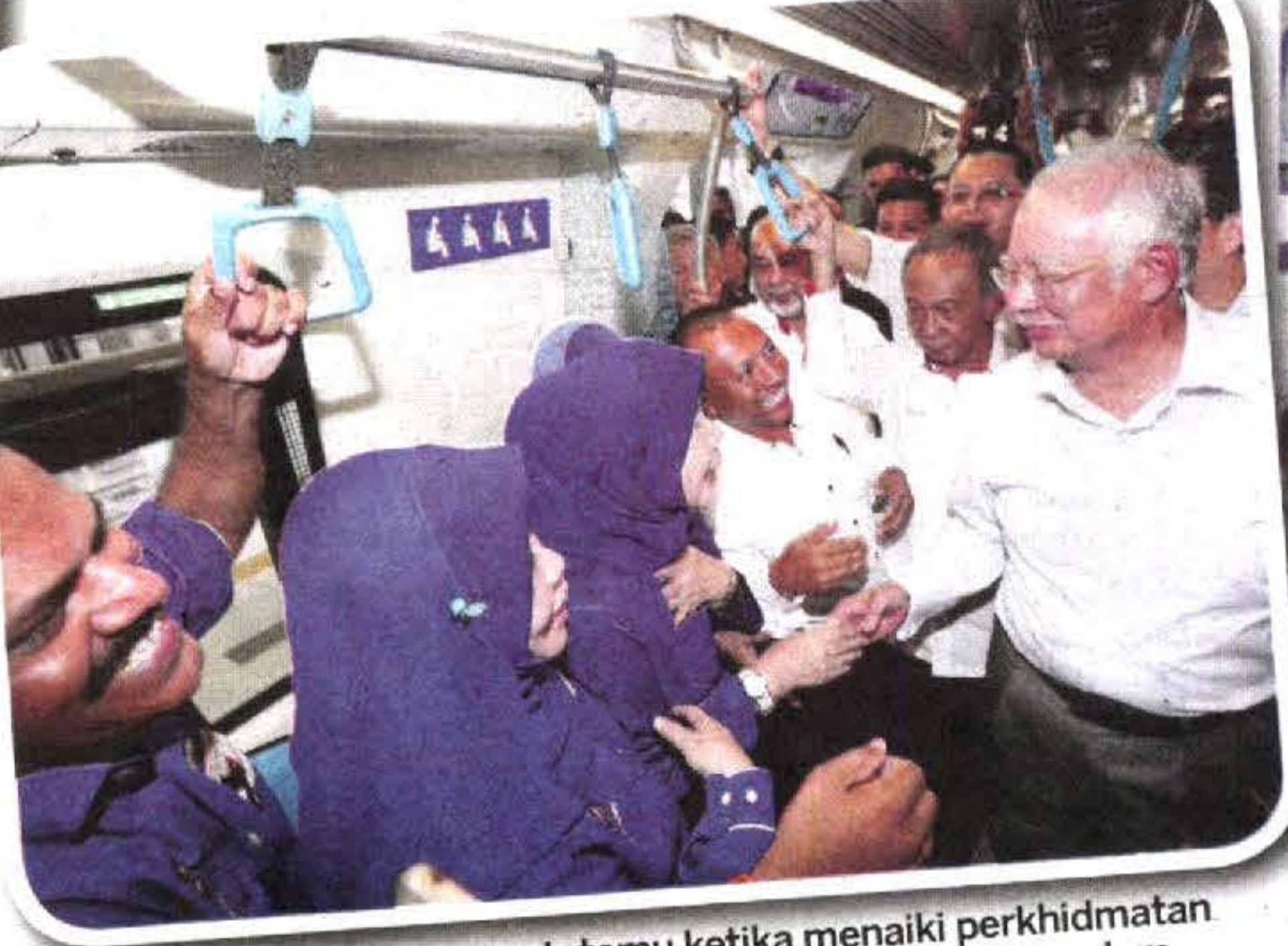
NAJIB bersalaman dengan tetamu ketika menaiki perkhidmatan MRT dari Stesen Kwasa Damansara ke Sungai Buloh semalam.