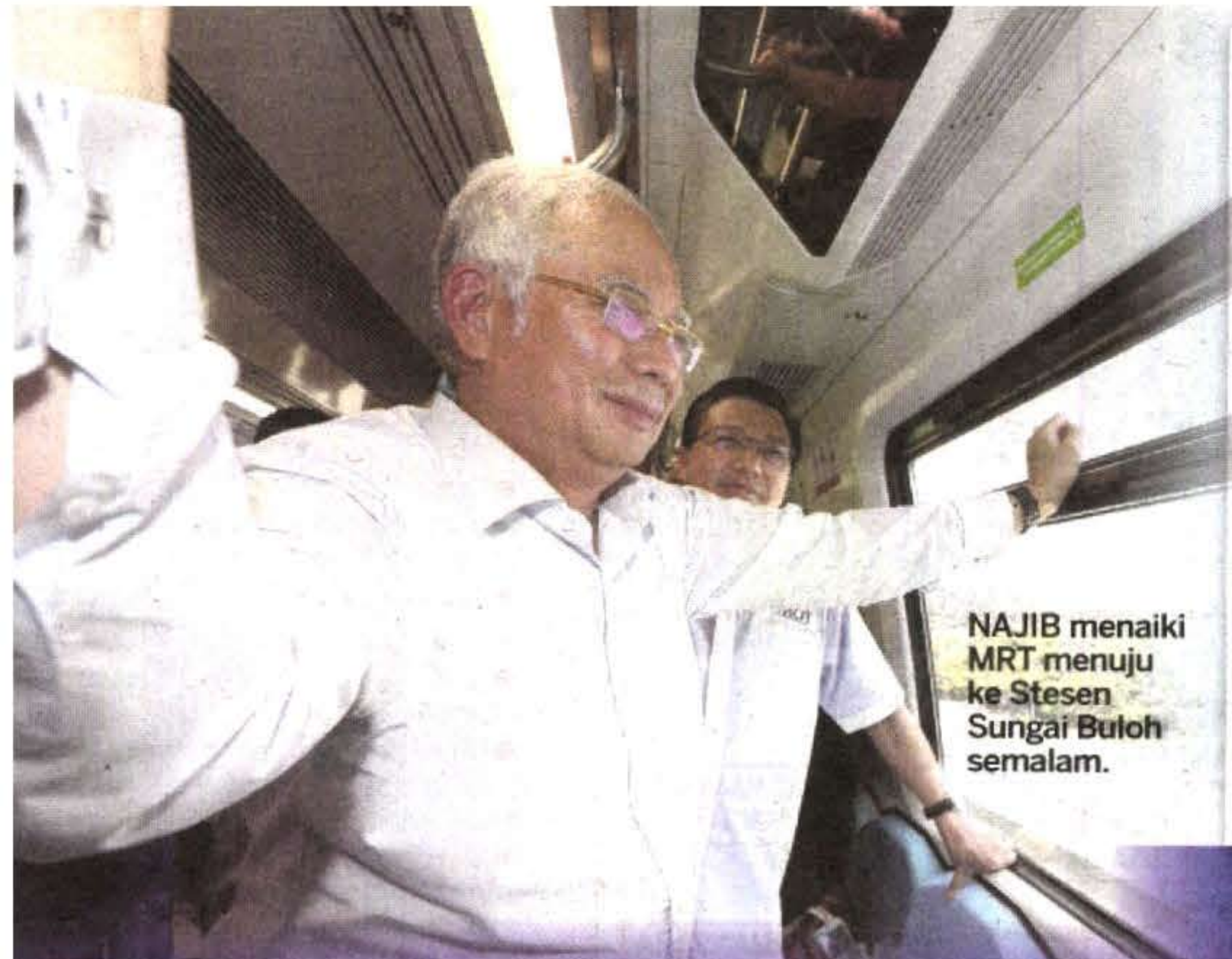
NAJIB menaiki MRT menuju ke Stesen Sungai Buloh semalam.