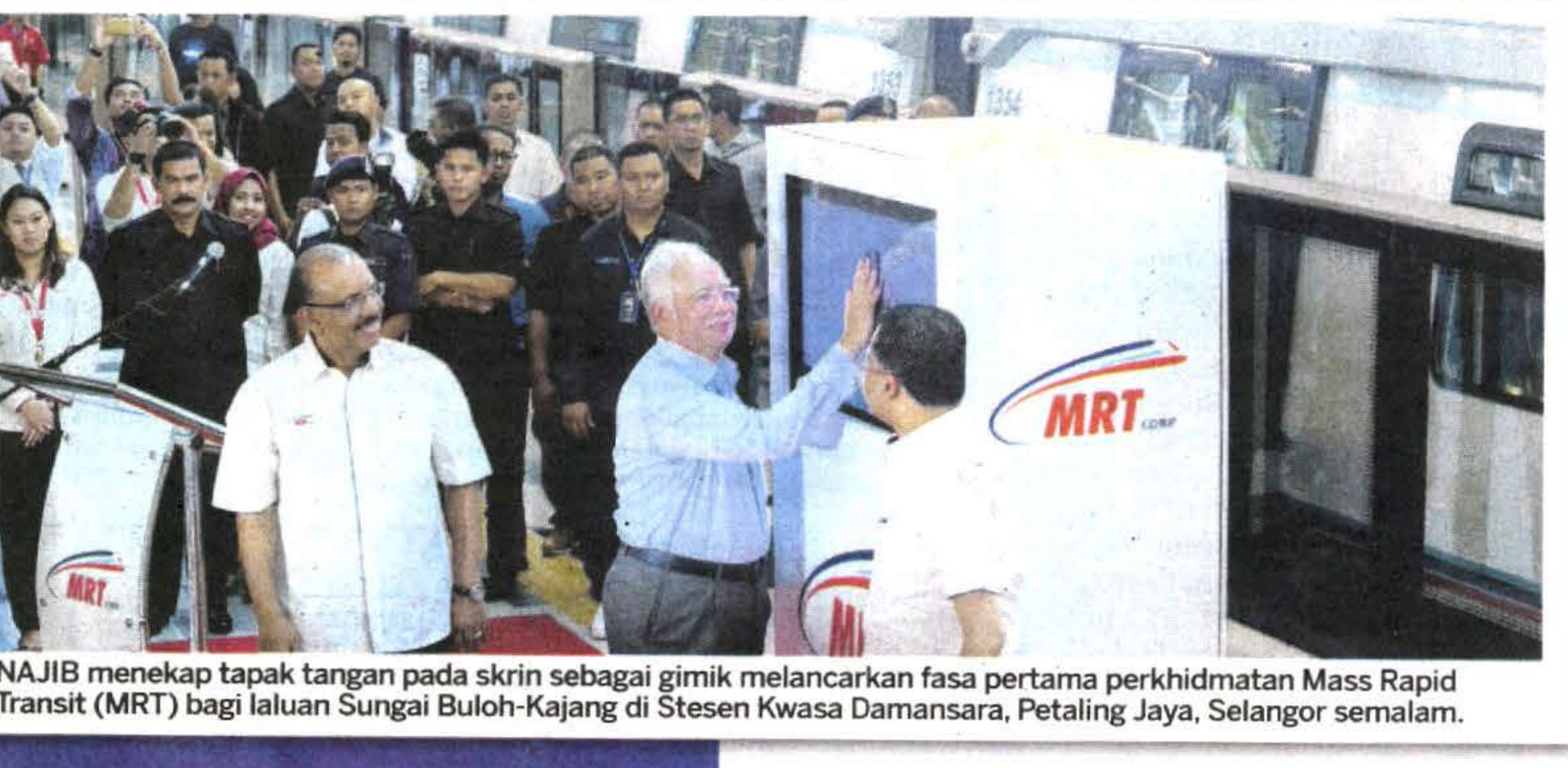
NAJIB menapak tangan pada skrin sebagai gimik melancarkan fasa pertama perkhidmatan Mass Rapid Transit (MRT) bagi laluan Sungai Buloh-Kajang di Stesen Kwasa Damansara, Petaling Jaya, Selangor semalam.