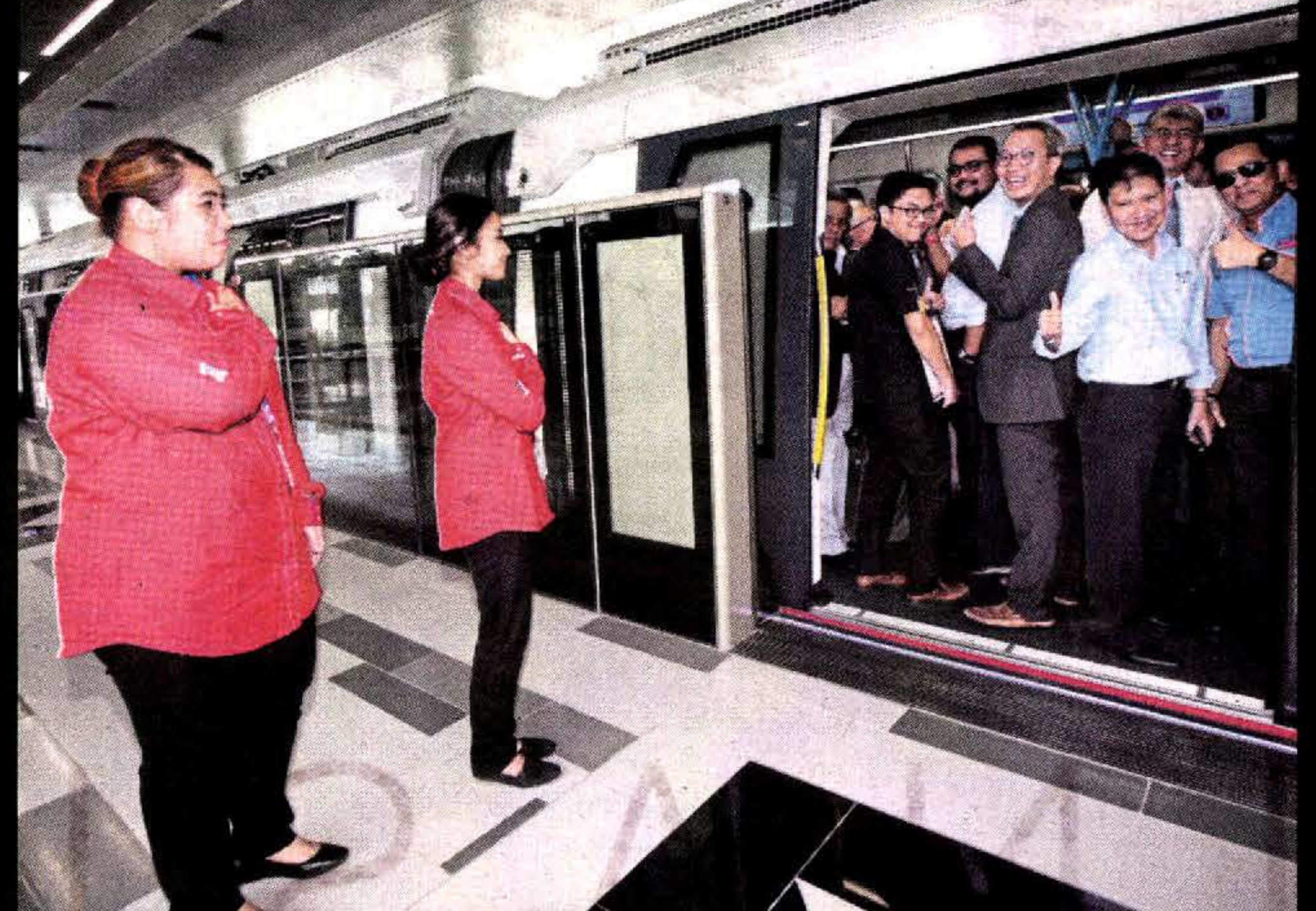
PENUMPANG menunjukkan isyarat bagus ketika Pelancaran MRT Fasa 1 laluan Sungai Buloh-Semantan.