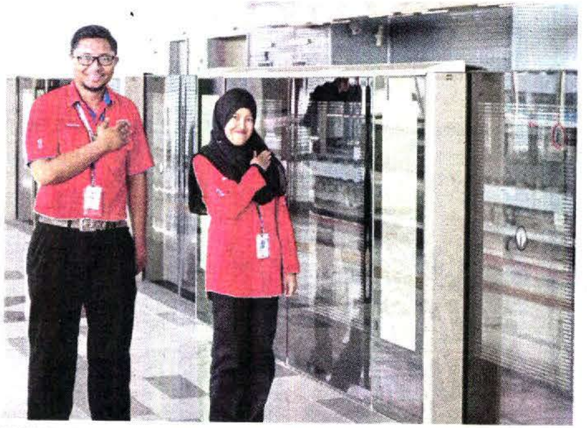
KAKITANGAN MRT menanti ketibaan tetamu yang menaiki tren.