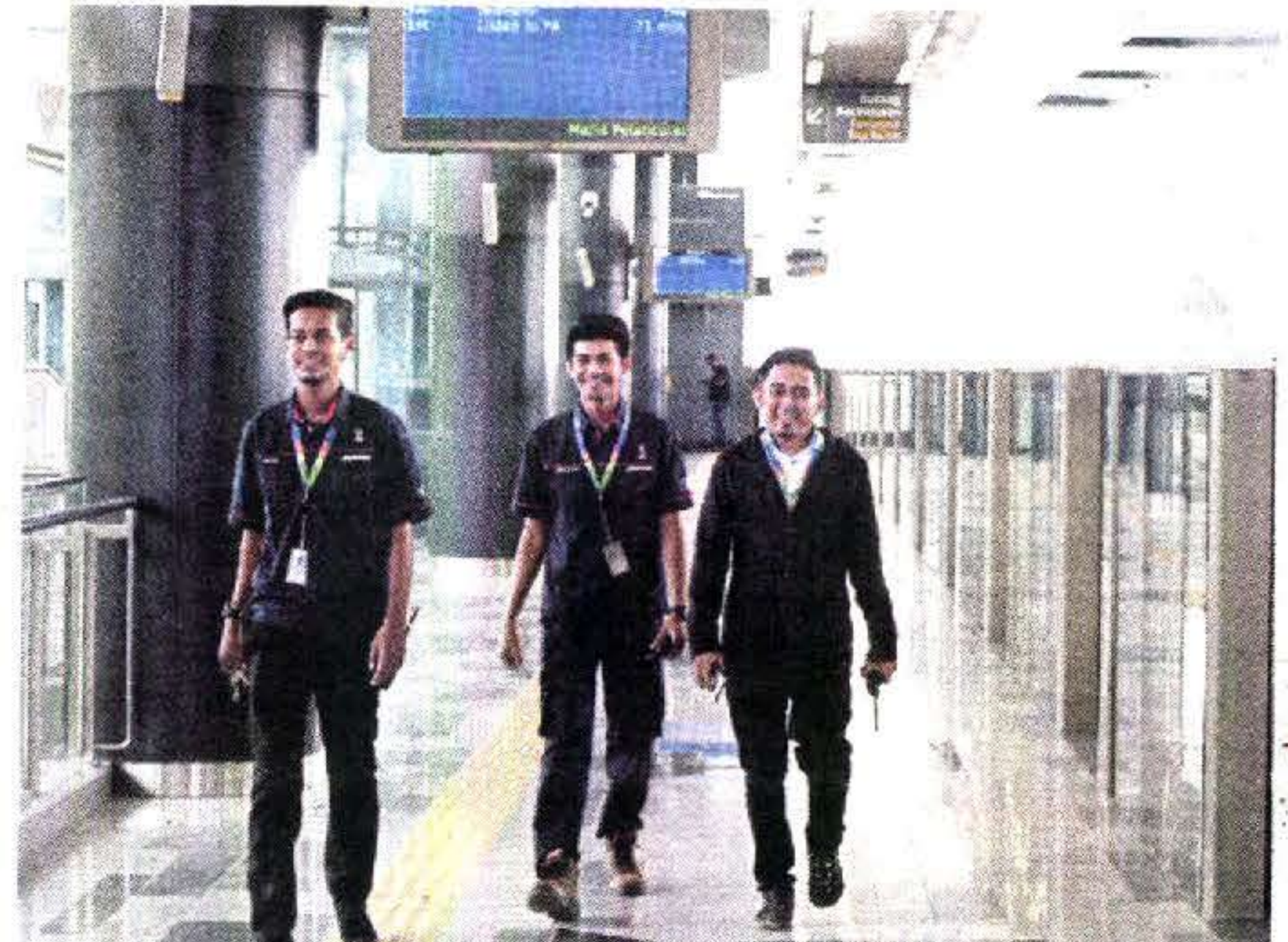
JURUTEKNIK penyelenggaraan MRT meninjau sekitar stesen di Sungai Buloh.