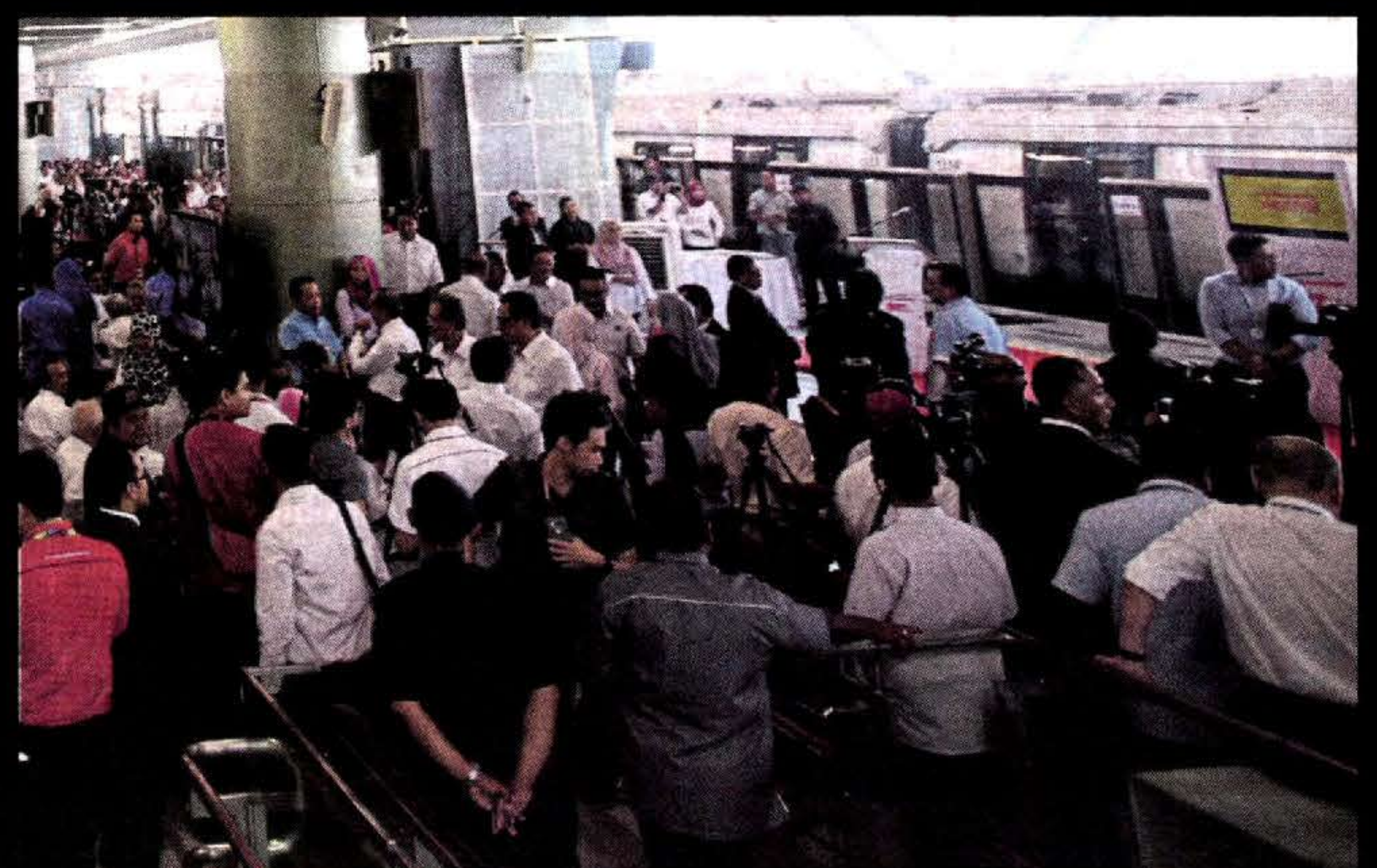
ANTARA jemputan yang berpeluang menaiki MRT ketika majlis Pelancaran MRT Fasa 1 laluan Sungai Buloh-Semantan.