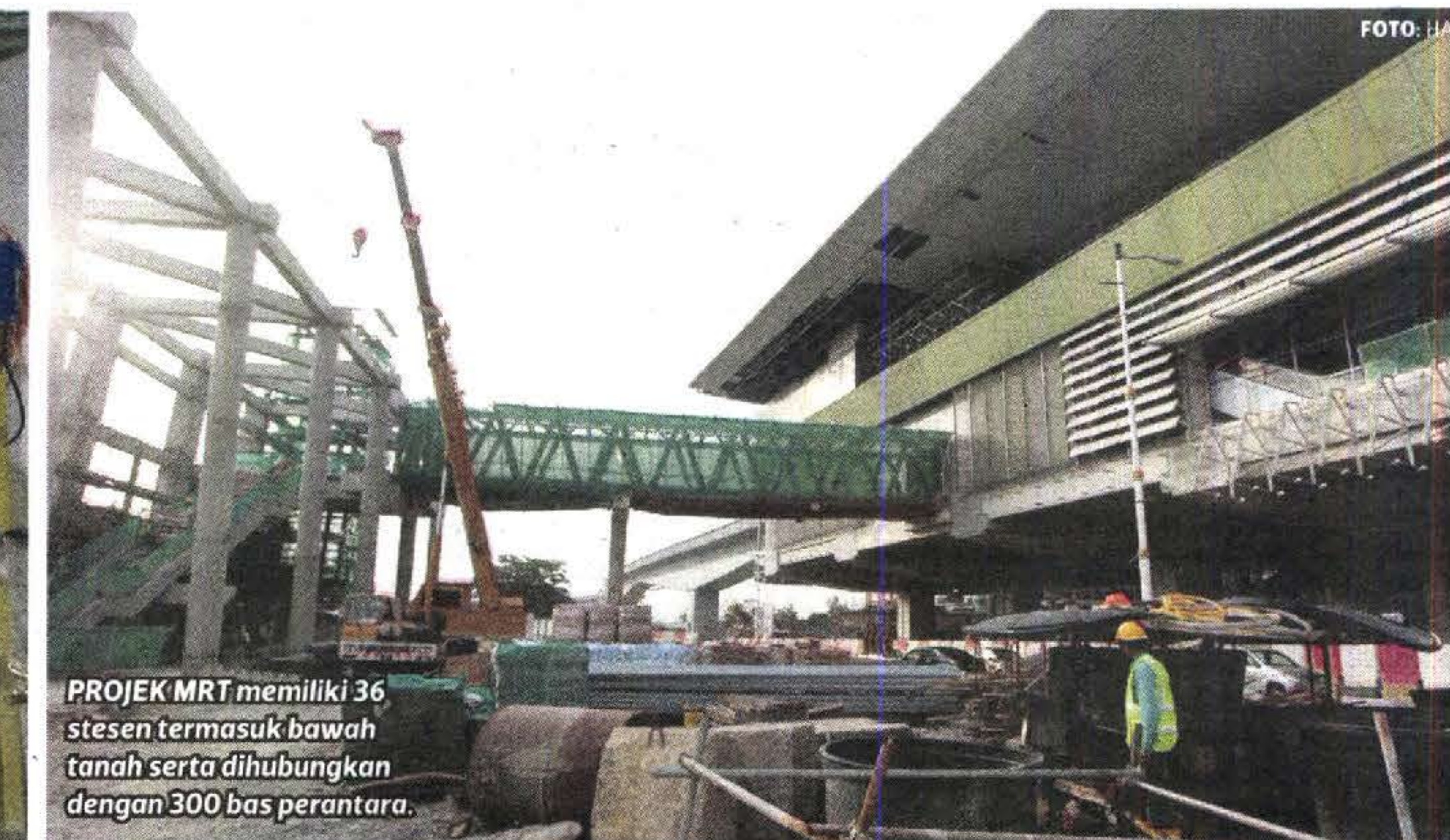
PROJEK MRT memiliki 36 stesen termasuk bawah tanah serta dihubungkan dengan 300 bas perantara.