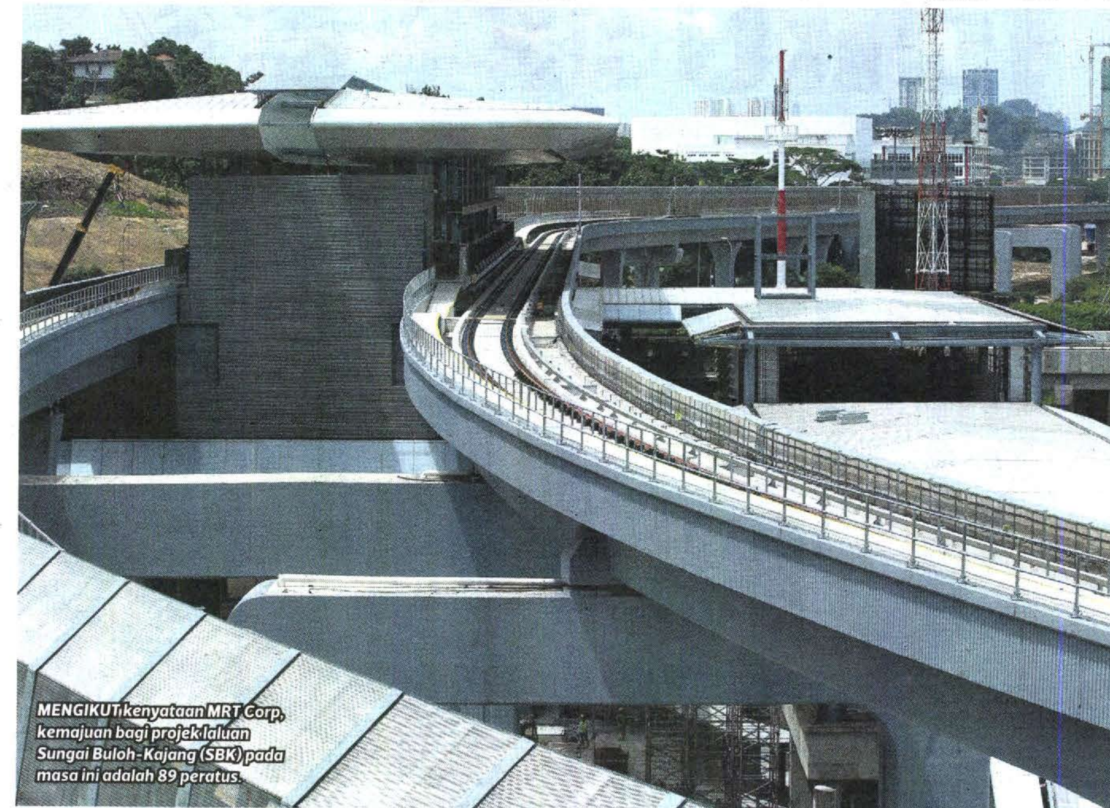
MENGIKUTI kenyataan MRT Corp, kemajuan bagi projek Laluan Sungai Buloh-Kajang (SBK) pada masa ini adalah 89 peratus.

"Mereka mempunyai persepsi yang berbeza terhadap Malaysia, jadi sebagai rakyat negara ini saya turut memainkan peranan dengan mempamerkan imej yang positif kepada mereka," katanya yang bangga menjadi anak Malaysia.