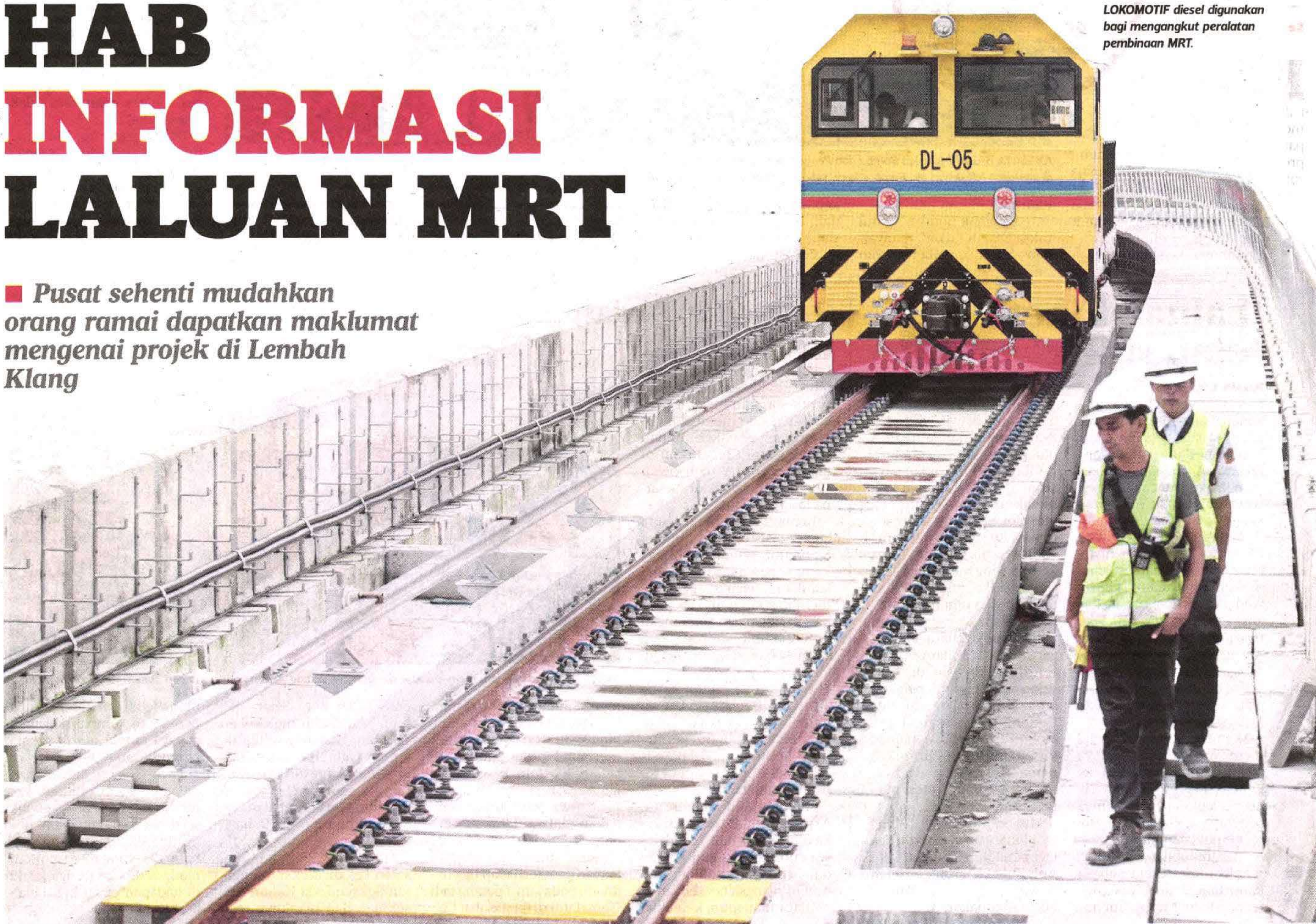
LOKOMOTIF diesel digunakan bagi mengangkut peralatan pembinaan MRT.

■ Pusat sehenti memudahkan orang ramai dapatkan maklumat mengenai projek di Lembah Klang