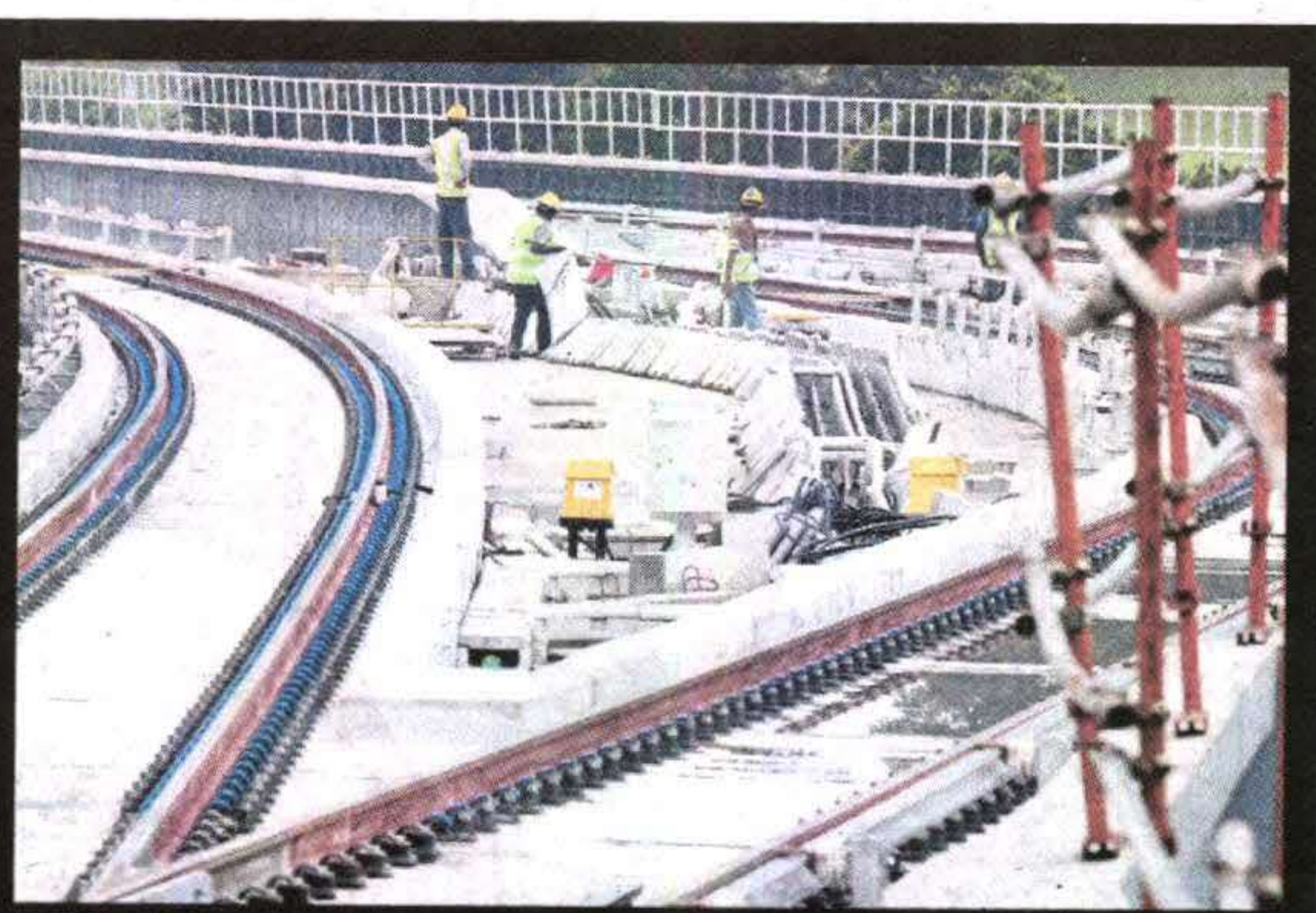
PEKERJA binaan bertungkus-lumus menyiapkan landasan MRT.