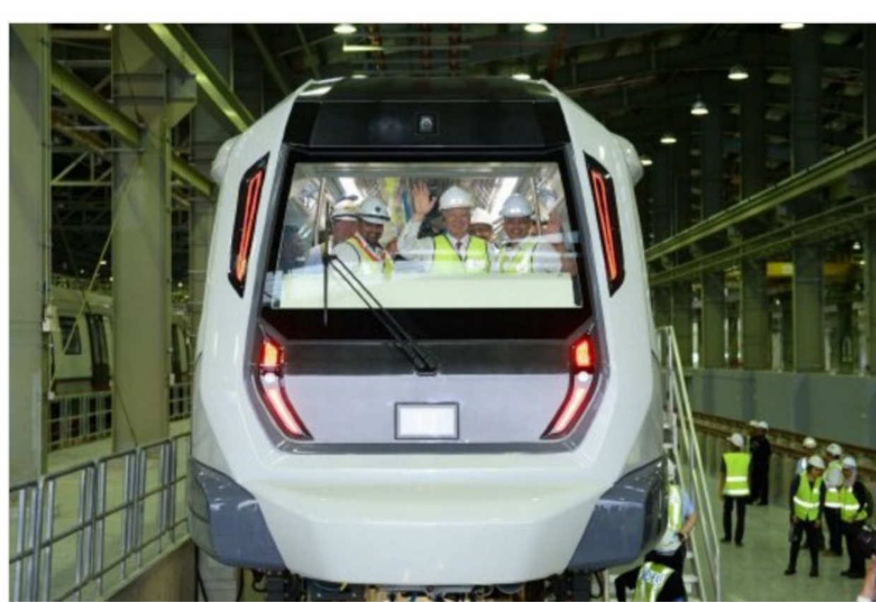
TREN yang akan digunakan MRT Corp bagi laluan MRT.

KUALA LUMPUR: Mass Rapid Transit Corporation Sdn Bhd (MRT Corp) menasarkannya 45 peratus nilai kerja bagi projek MRT Laluan Dua Sungai Buloh-Serdang-Putrajaya (SSP) akan diagihkan kepada kontraktor Bumiputera.