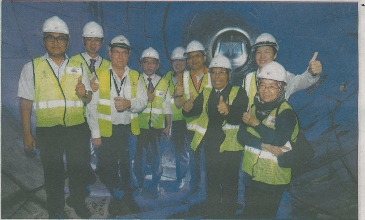
阿末菲沙(右3起)及沙里尔莫达亲临中央艺术坊捷运站地下隧道工地, 见证隧道挖掘工程的完成, 并竖起拇指赞赏工程进度理想。