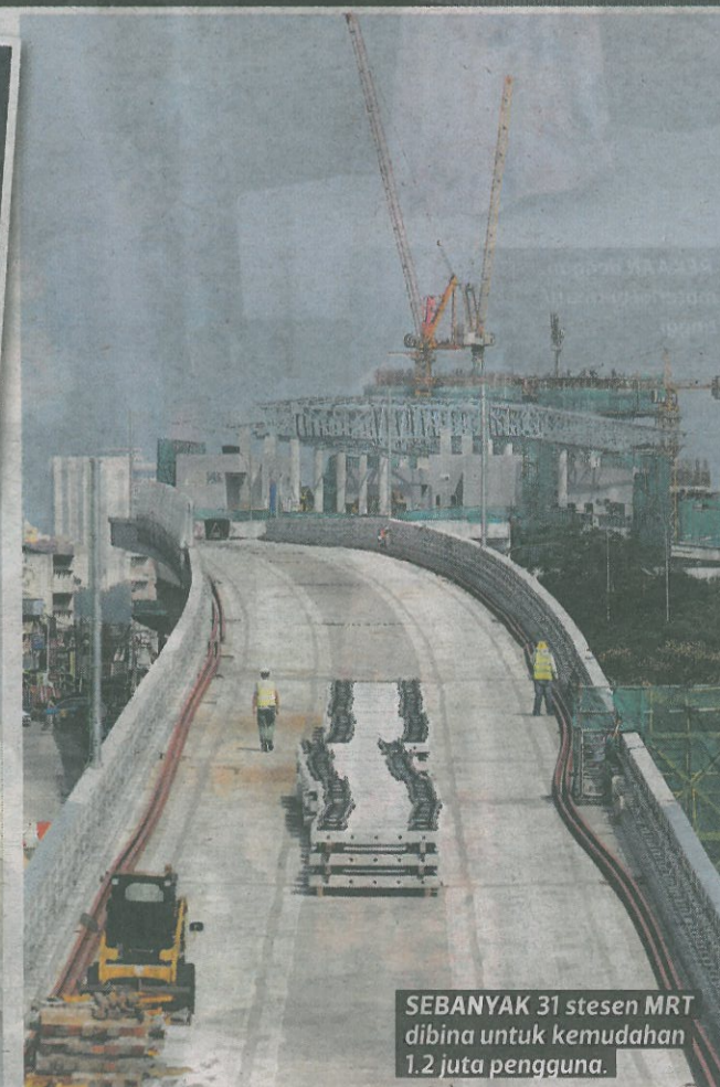
SEBANYAK 31 stesen MRT dibina untuk kemudahan 1.2 juta pengguna.