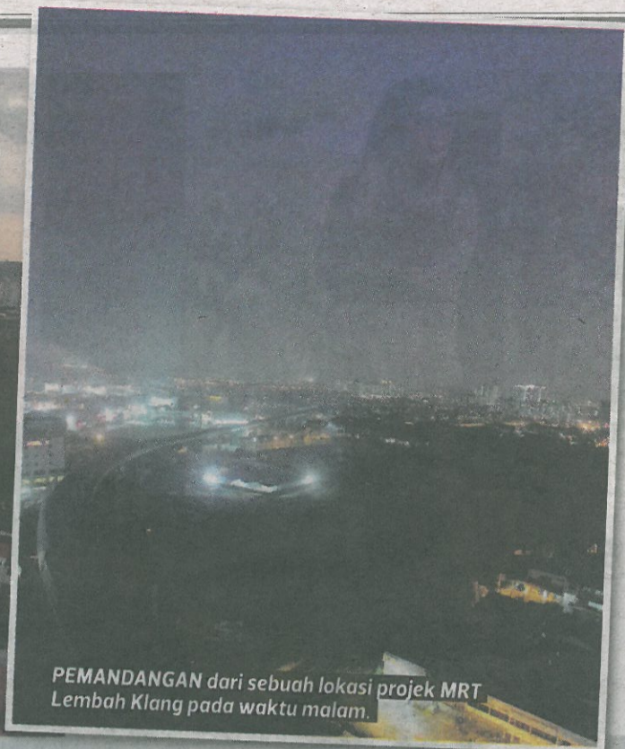
PEMANDANGAN dari sebuah lokasi projek MRT Lembah Klang pada waktu malam.