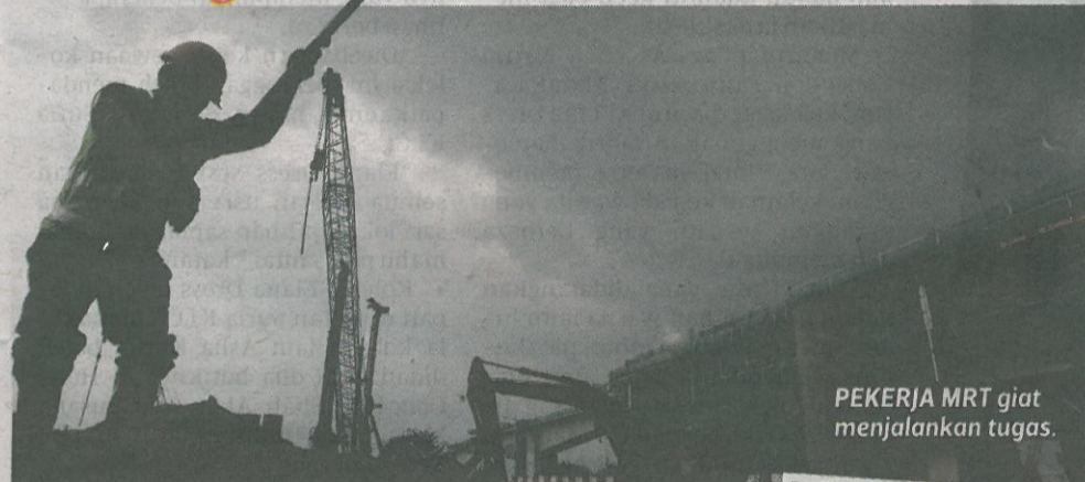
PEKERJA MRT giat menjalankan tugas.