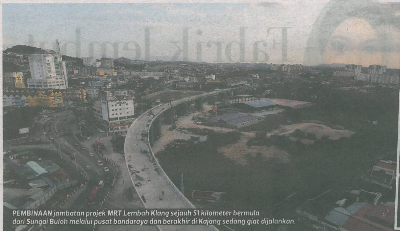
PEMBINAAN jambatan projek MRT Lembah Klang sejauh 51 kilometer bermula dari Sungai Buloh melalui pusat bandaraya dan berakhir di Kajang sedang giat dijalankan.