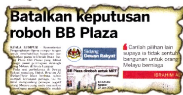
KERATAN Kosmo! 29 Jun 2012.

"Pihak MRT Corp. bersetuju membayar pampasan kepada kesemua lima kiosk yang